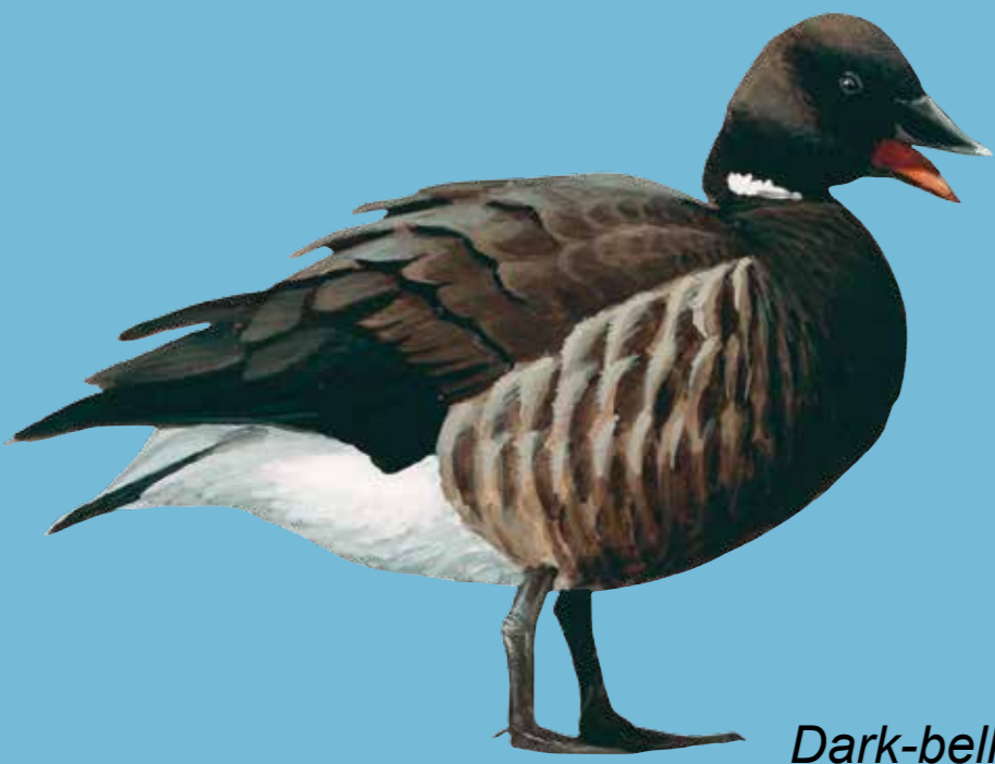
Dark-bellied Brent Goose Rotgans Ringelgans Knortegås