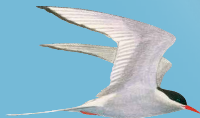
Arctic Tern Noordse Stern Küstenseeschwalbe Havterne