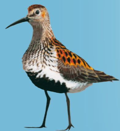
Dunlin Bonte Strandloper Alpenstrandläufer Almindelig Ryle