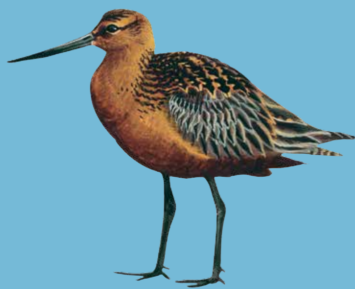
Bar-tailed Godwit Rosse Grutto Pfuhschnepfe Lille Kobbersneppe