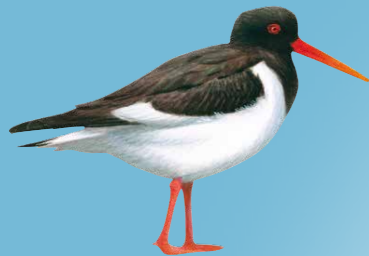
Eurasian Oystercatcher Scholekster Austernfischer Strandskade

Breeding ground Broedgebied Brutgebiet Yngleområde