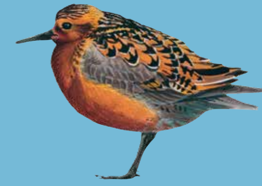
Red Knot Kanoetstrandloper Knut Islandsk Ryle