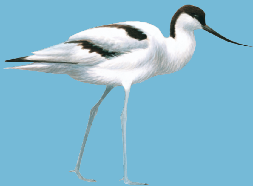
Pied Avocet Kluut Säbelschnäbler Klyde