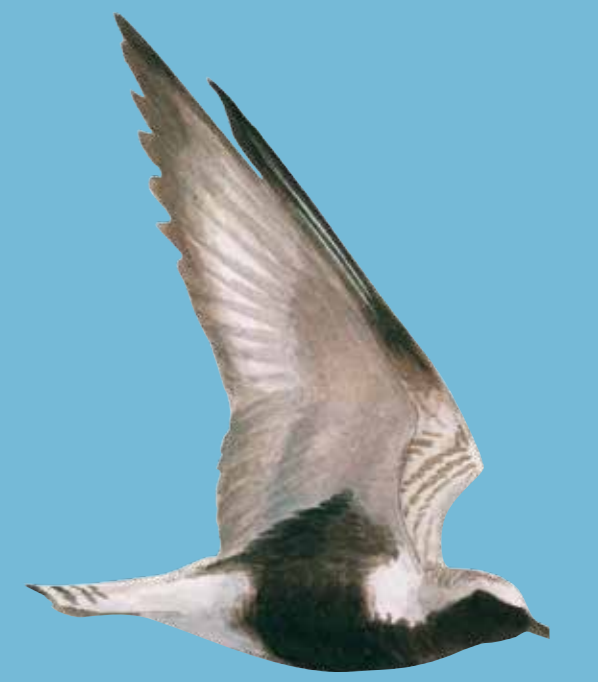
Grey Plover Zilverplevier Kiebitzregenpfeifer Strandhjejle

Beskyttede fugle kræver beskyttede vådområder!